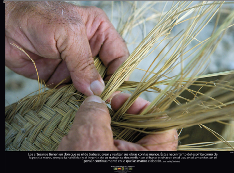
Los artesanos tienen un don que es el de trabajar, crear y realizar sus obras con las manos. Estas nacen tanto del espíritu como de la propia mano, porque la habilidad y el talento se transmiten en el trabajo cotidiano en el que, en el momento, se piensa concretamente en lo que las manos elaboran.